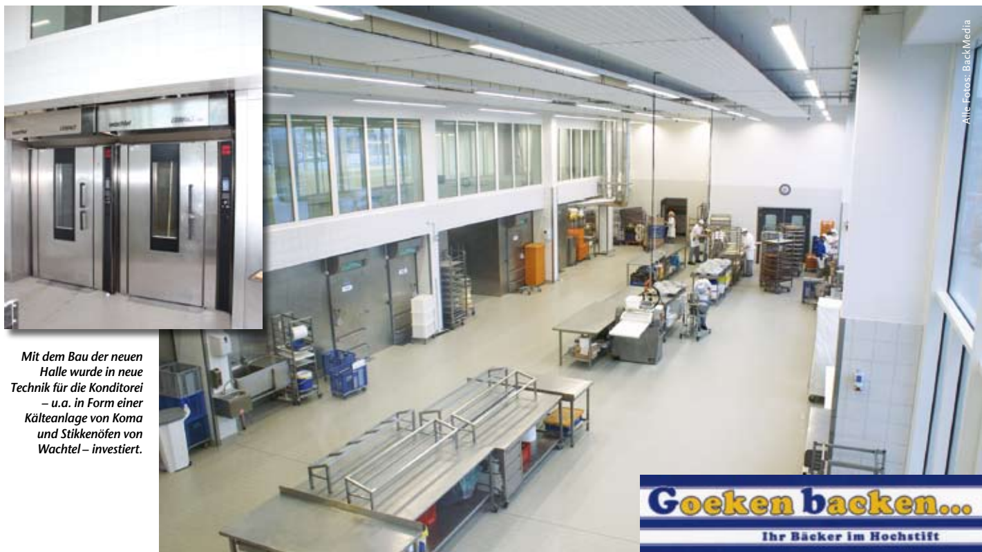
Mit dem Bau der neuen Halle wurde in neue Technik für die Konditorei – u.a. in Form einer Kälteanlage von Koma und Stikkenöfen von Wachtel – investiert.