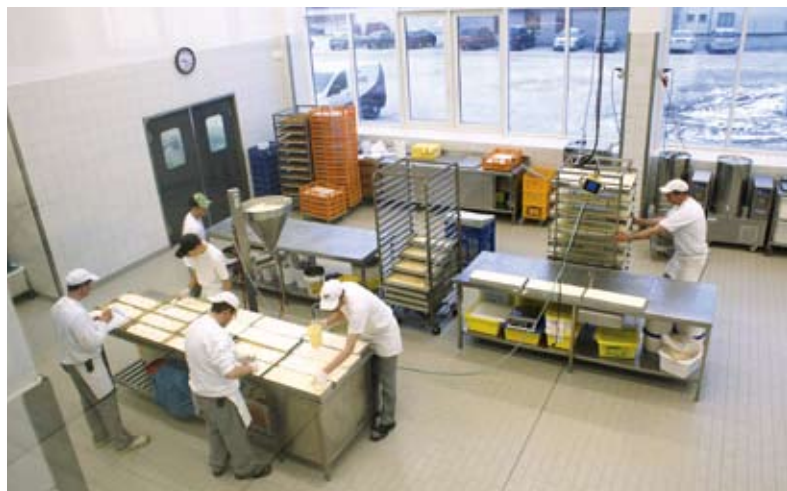
Der neue Bereich bietet für Konditorei, Feingebäck und Snacks beste Voraussetzungen.

Der Erwerb eines 11.000 m 2 großen Nachbargrundstücks am Siedlerplatz in Bad Driburg schuf die Voraussetzung für eine Erweiterung. Mit der Firma Elektrom, in deren Hand die Gesamtplanung liegen sollte, gab es bereits 2009