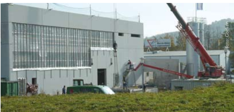
Nach dem Gießen der Bodenplatte in der Größe von 24 x 40 Metern wurden die Stützen mit den Auflegern aufgestellt und später mit den Fertigbauteilen für die Wände verbunden.