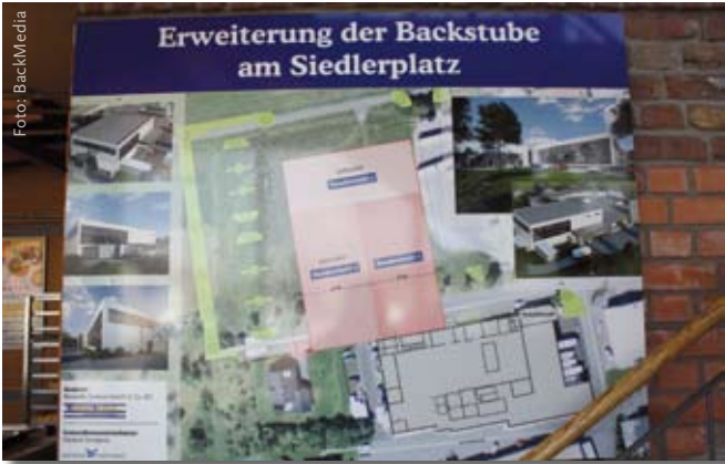
Drei Millionen Euro fließen in die erste von drei geplanten Ausbaustufen. Auch die Kunden werden über die Pläne informiert.

großen Pufferspeicher beheizt wird, läuft täglich mehrere Stunden, nicht zuletzt auch, weil heute jeder Korb, der wieder in den Betrieb kommt, zunächst einen Spülgang absolviert. Energieeffizienz wird nicht nur durch die Wärmerückgewinnungsanlage, sondern auch durch die Photovoltaikanlage auf dem Dach sowie den Einsatz besonders sparsamer LED-Beleuchtung erreicht.